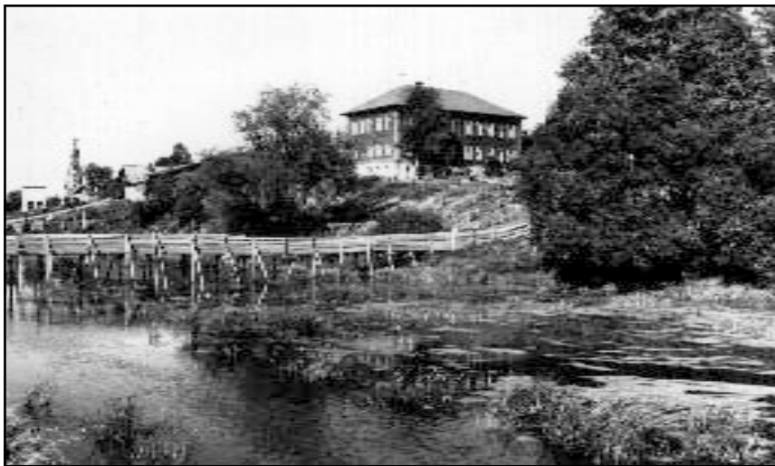
Лавы у городского сада.