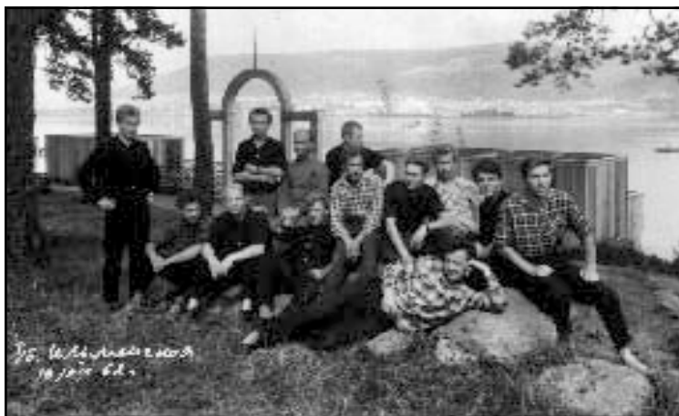
Команда механического завода (г. Миасс, 1962 г.)