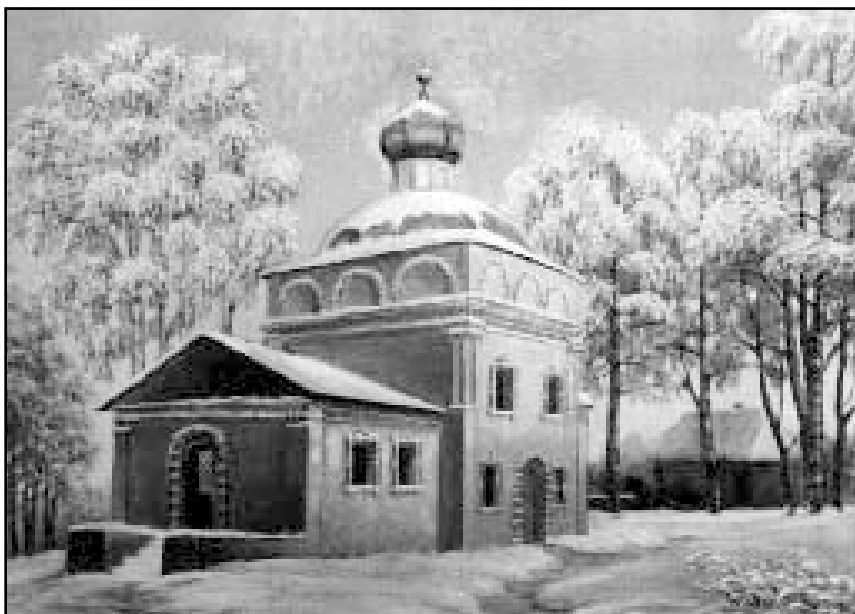
Зима. Благовещенская церковь.