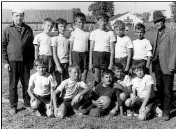
Команда “Чайка” (1975 год).