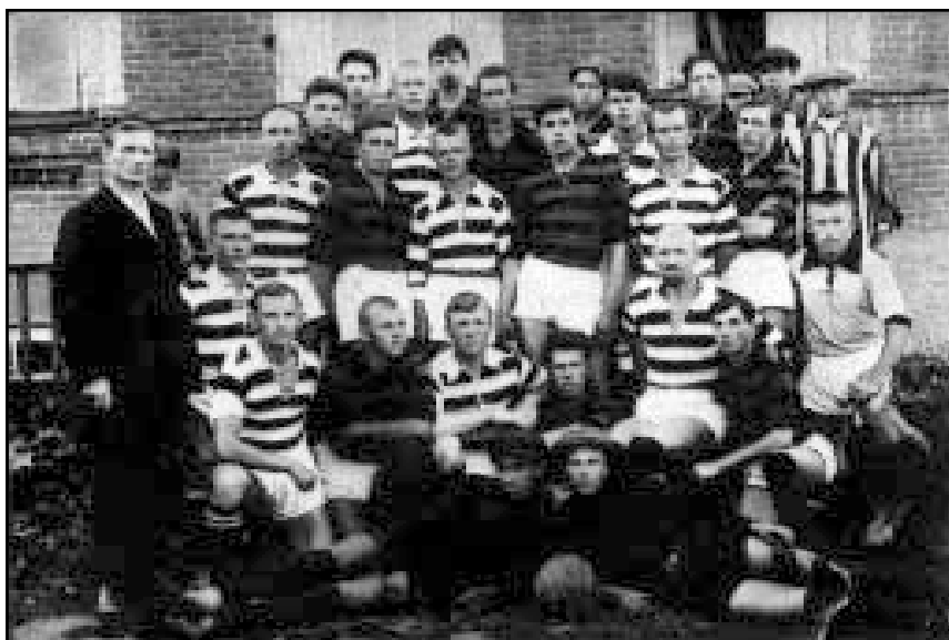
Участники матча Советск—Яранск на первенство губернии (1929 год)

В 1927 году команда Яранска в финале первенства Вятской губернии заняла второе место, уступив лишь команде Вятки. Тогда же двое яраничей, в составе сборной губернии, принимали участие в товарищеском матче против команды финских рабочих.