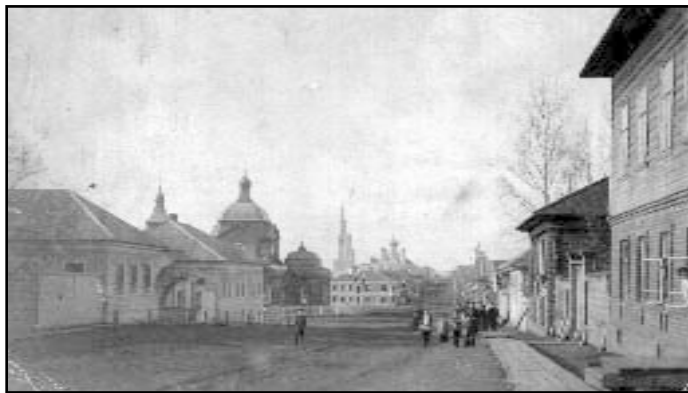
Улица Успенская в начале XX века.