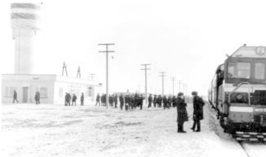
Первый поезд на станции Яранск.

1976 годом, в 1985 году ее грузооборот увеличился в пять раз. Два раза в день от перрона вокзала отходят пригородные пассажирские поезда на Йошкар-Олу. В одном из плацкартных вагонов вечернего поезда можно без пересадок доехать до Казани», — писала «Кировская правда» в 1986 году. 33