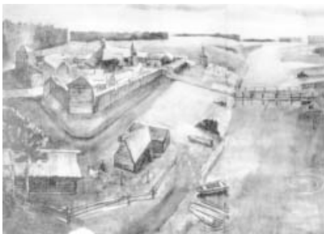
Яранская крепость в начале XVII века. Реконструкция Михаила Мотовилова, 1983.

Более четырёх столетий назад русская военная дружина местом для построения крепости избрала высокий холм на правом берегу реки Ярани, окруженный с севера и с запада водой, с юга — оврагом, а с востока — бором. Крепость занимала примерно площадь современного