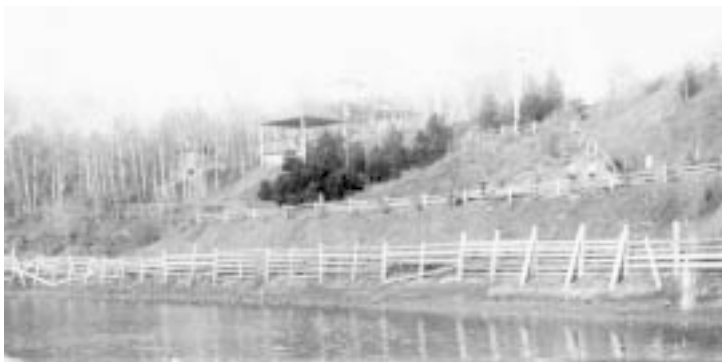
Городской сад. Беседка «Ласточкино гнездо».

Через этот парк мы подойдем к городскому саду , который для многих яраничей является одним из самых памятных и любимых