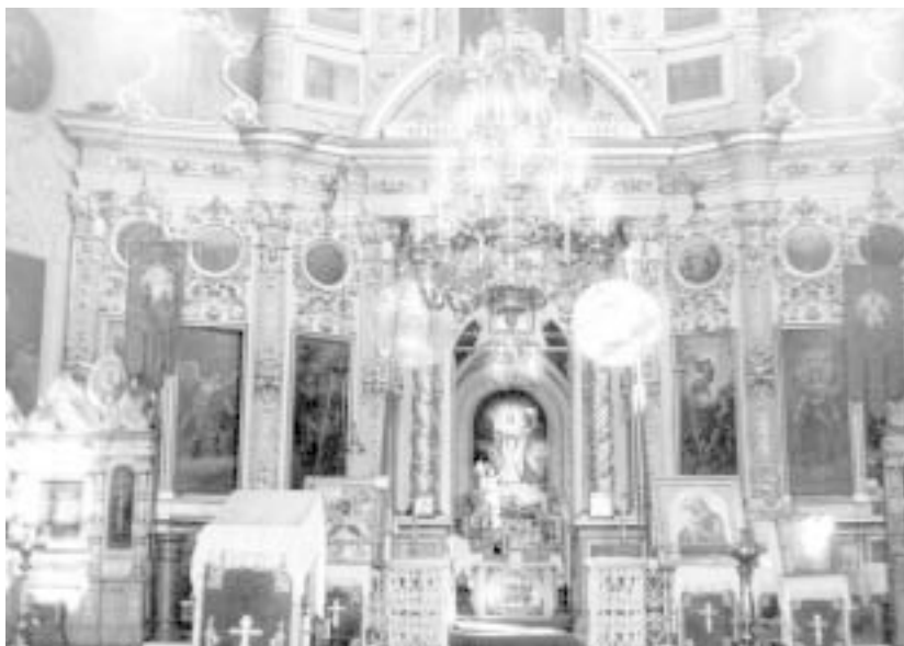
Иконостас Успенского собора.