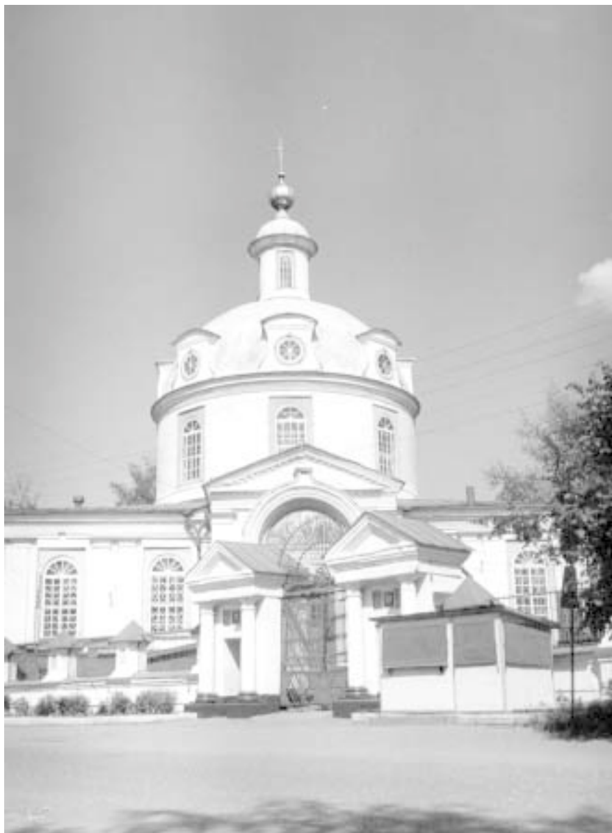
Собор Успения Пресвятой Богородицы.