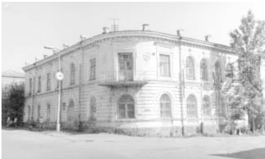
Здание центральной районной библиотеки.