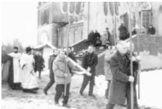
Крестный ход перед установкой креста на колокольню Троицкой церкви.

Символом возрождения и надежды стал день 4 ноября 2001 года — день почитания Божьей Матери за её заступничество, — когда купол самый высо-