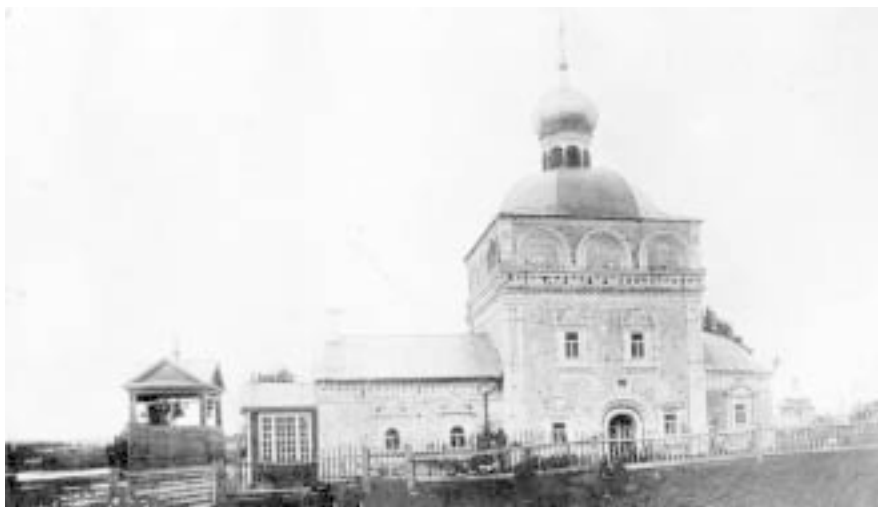
Благовещенская церковь. Фото начала XX века.

существовал в древности, когда только появился Яранск. Сейчас её реставрируют, и вскоре она станет действующей. Летом 2000 года над её куполом установлен крест.