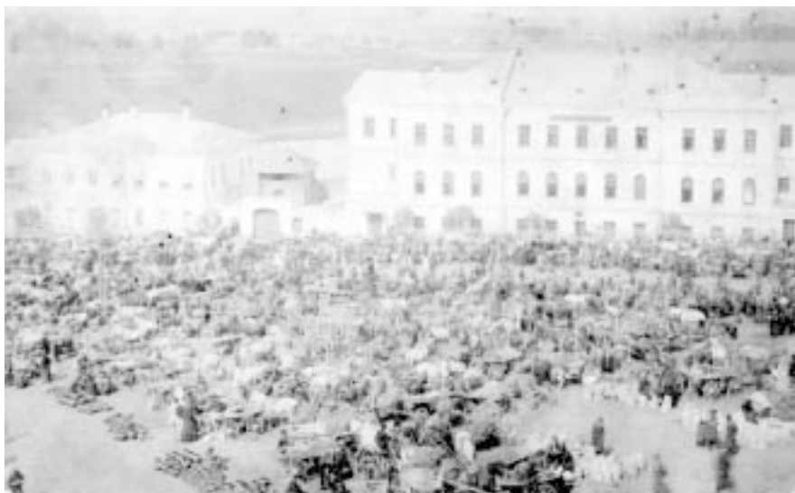
Ярмарка возле здания духовного училища.

Во времена духовного училища рядом шумели ярмарки и базары. На месте парка размещалась торговая площадь, посреди которой была