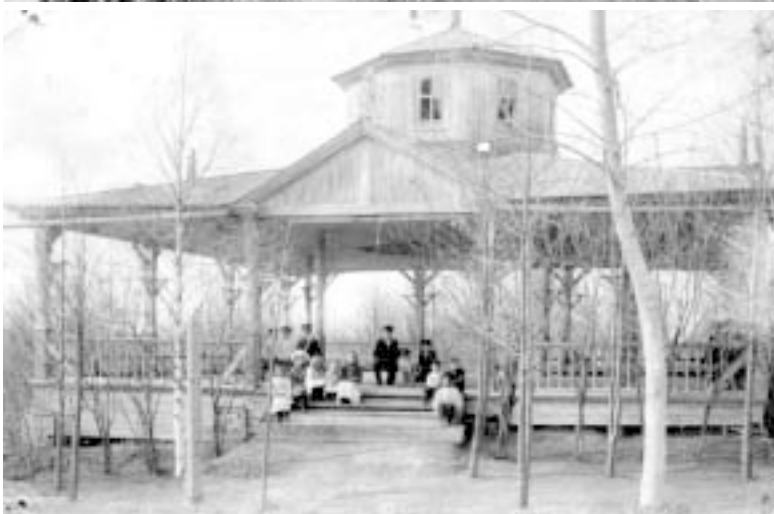
В городском саду начала XX века.

городских мест. Он был заложен в 70-е годы XIX века на крутом берегу Ярани. Здесь звучала музыка духовых оркестров, стояли беседки, действовал фонтан, работали летние кинотеатр и кафе.