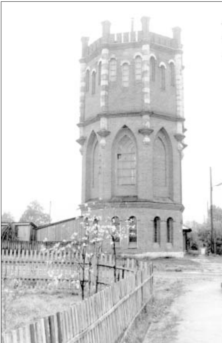
Водонапорная башня. Фото конца 1970-х годов.