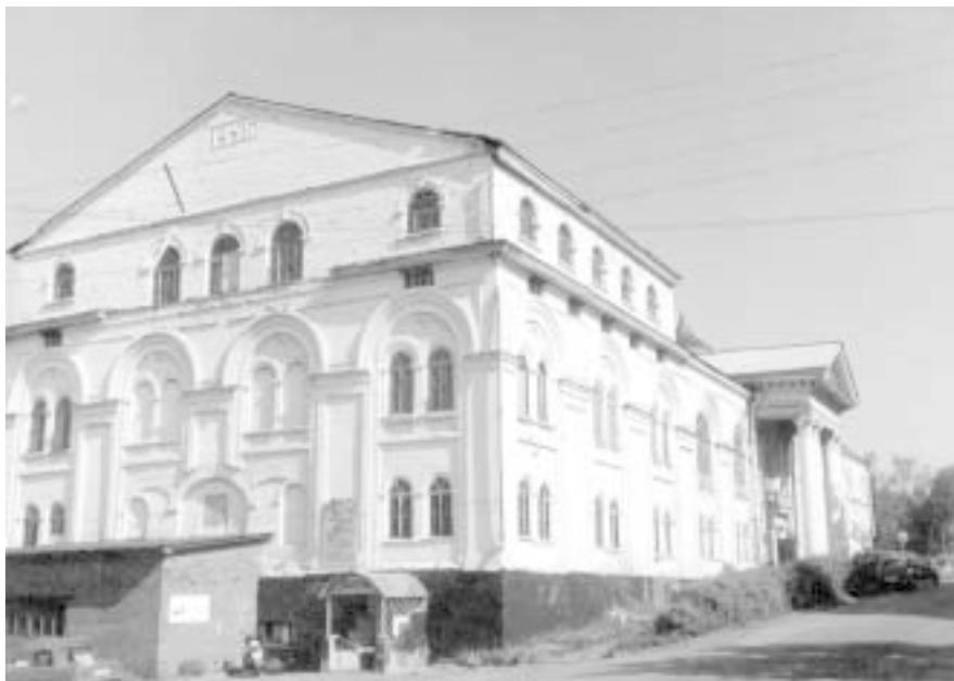
Здание районного Центра досуга.