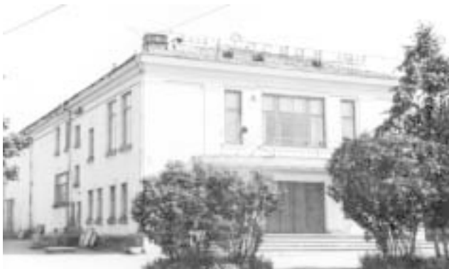
Кинотеатр «Россия». Фото 1970-х годов.

войны открыли памятник «Победители» , изготовленный на народные средства. Он был отлит из бронзы на Мытищинском заводе художественного литья Московской области. Его архитектор — С. Кулёв, скульптор — Н. Браун. Поэт Б. А. Яранцев написал стихи для «Яранского вальса», положенные на музыку Ю. Б. Новосёловым: